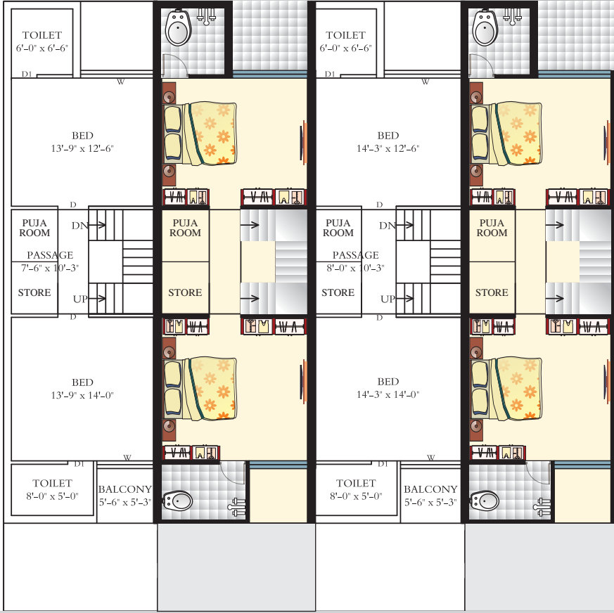
Second Floor Plan