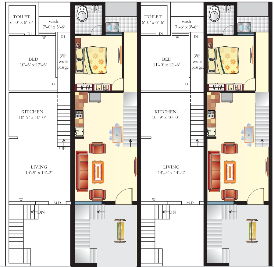
Ground Floor Plan