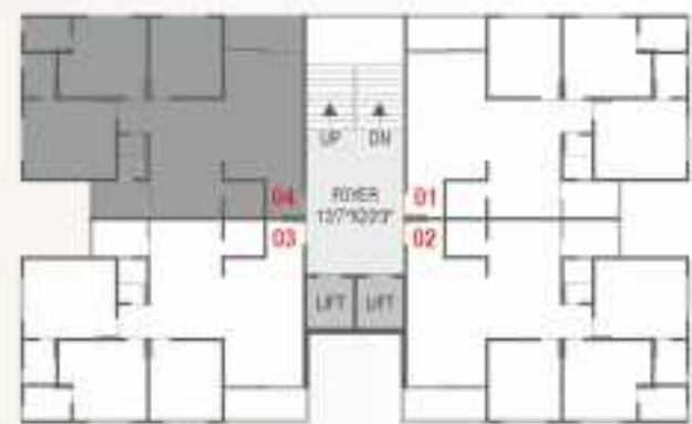
UNIT PLAN -3