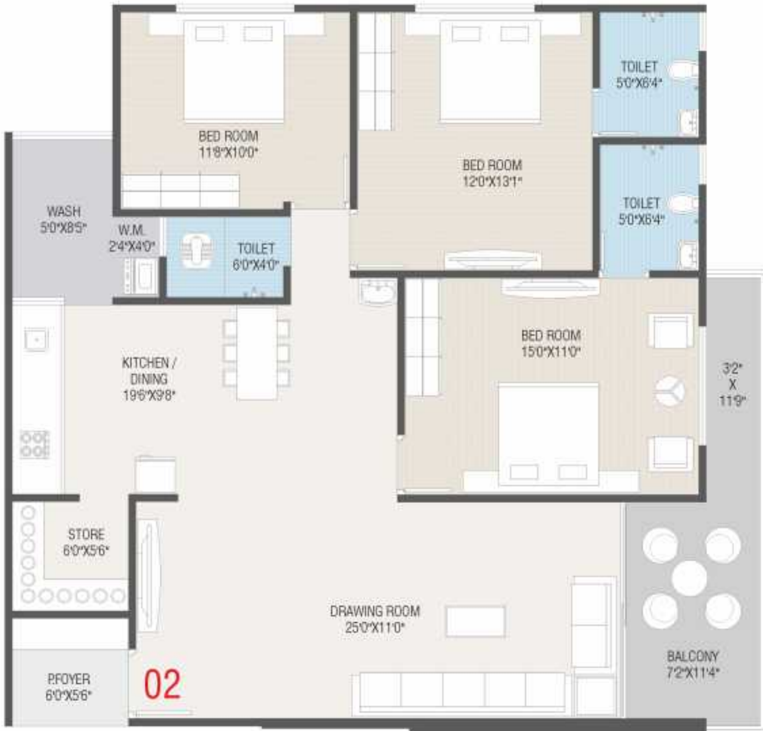
UNIT PLAN -2