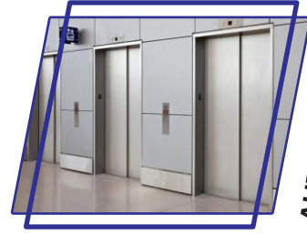
AUTO DOOR LIFT