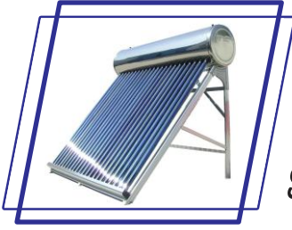
SOLAR WATER HEATER