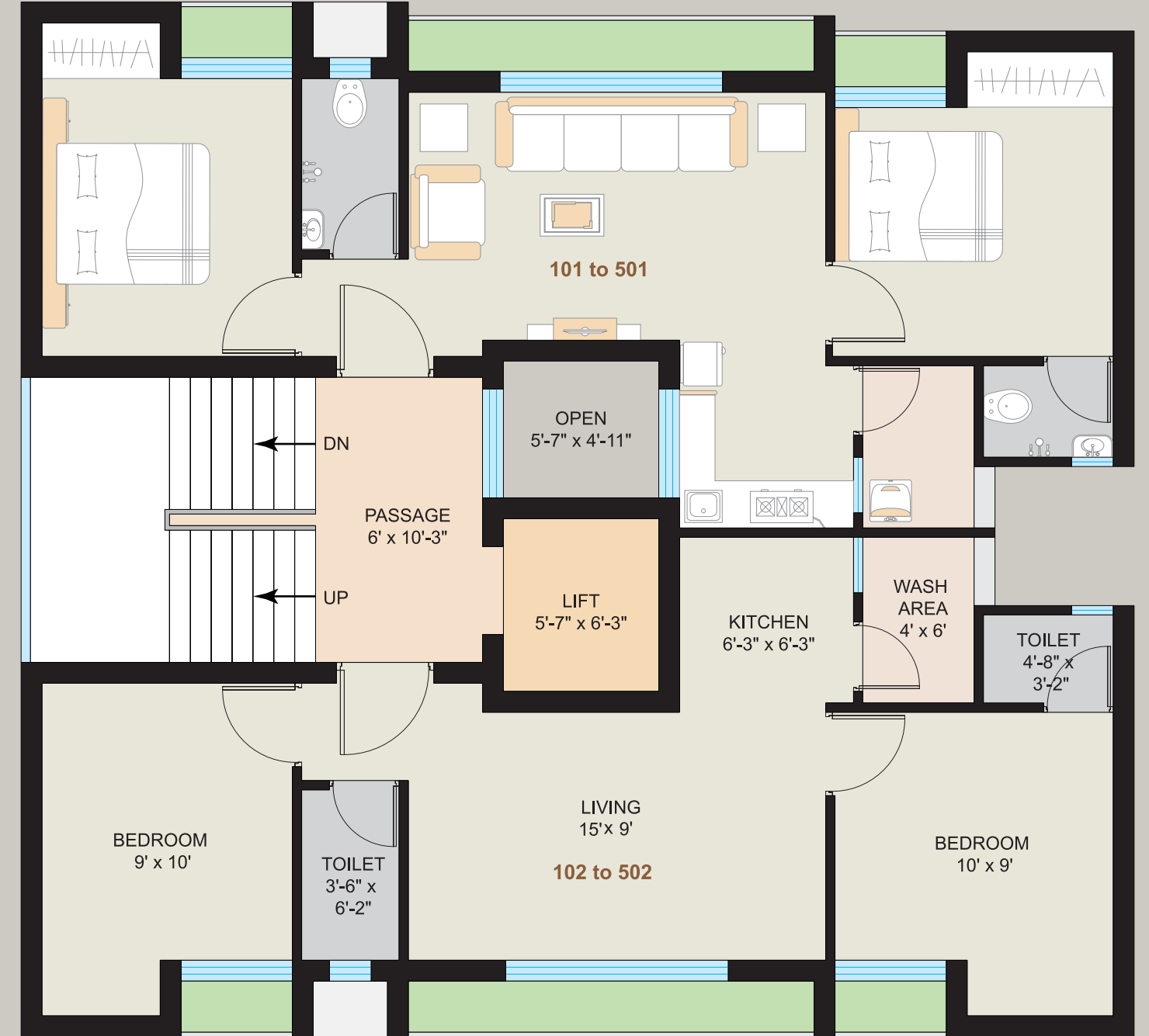
Typical Floor Plan (1st to 5th)

ફ્લેટના અંદરના દરવાજા લેમીનેટેડ ફ્લશ ડોર.