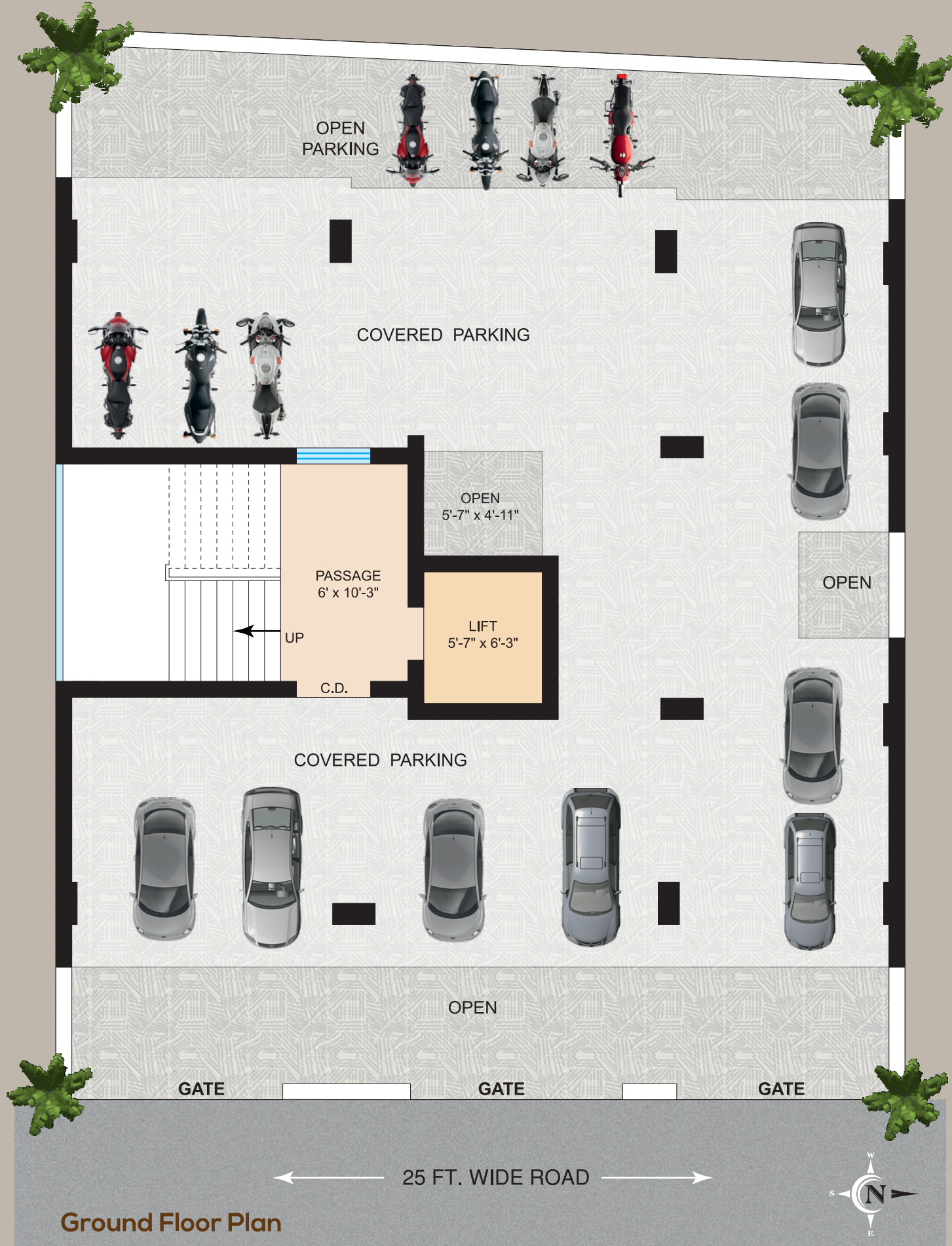
Ground Floor Plan