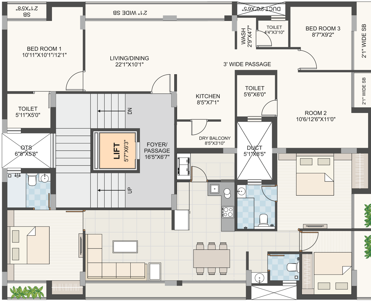
TYPICAL FLOOR PLAN (1st TP 5th/)