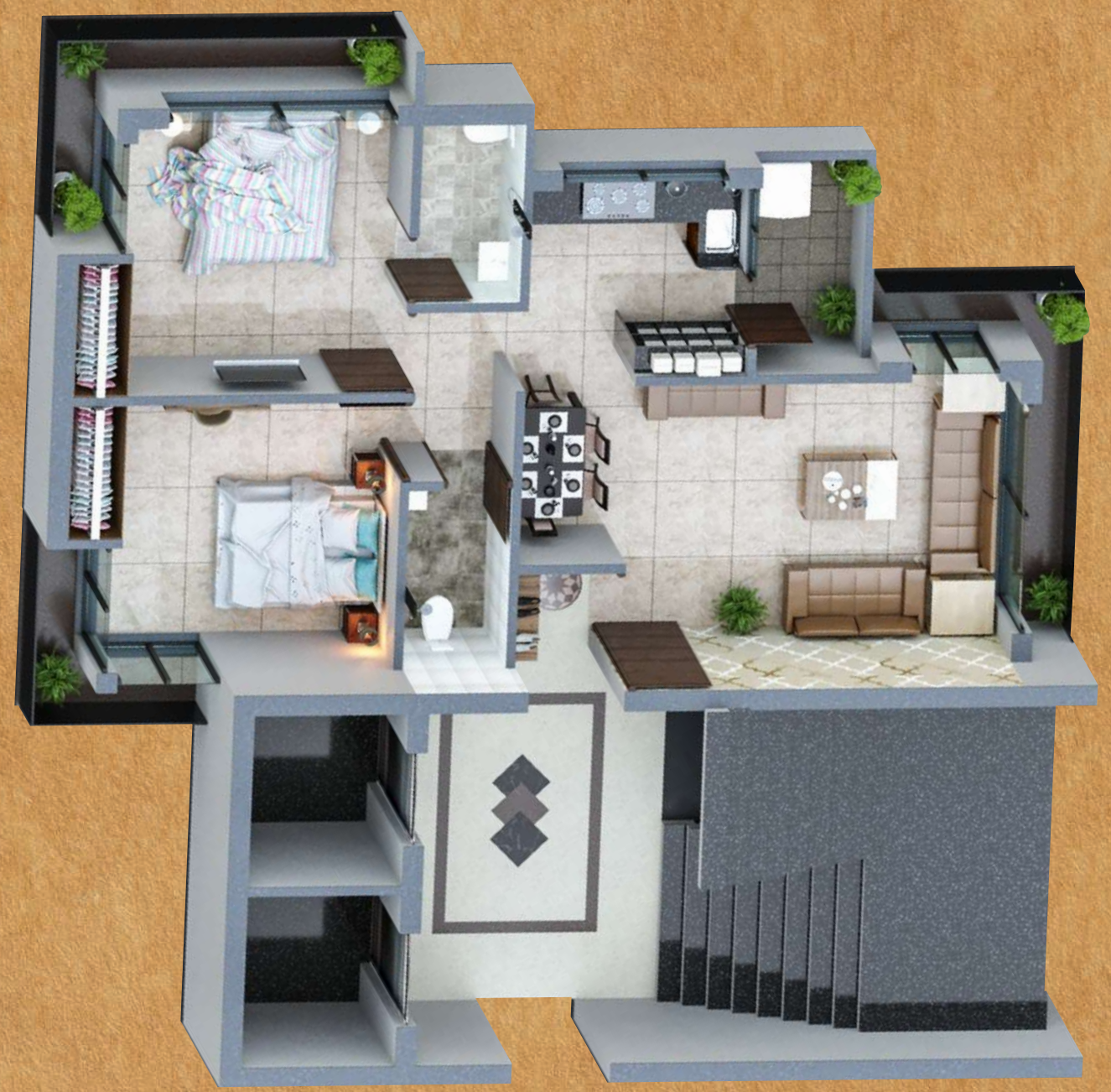
2 BHK TYPICAL FLOOR PLAN