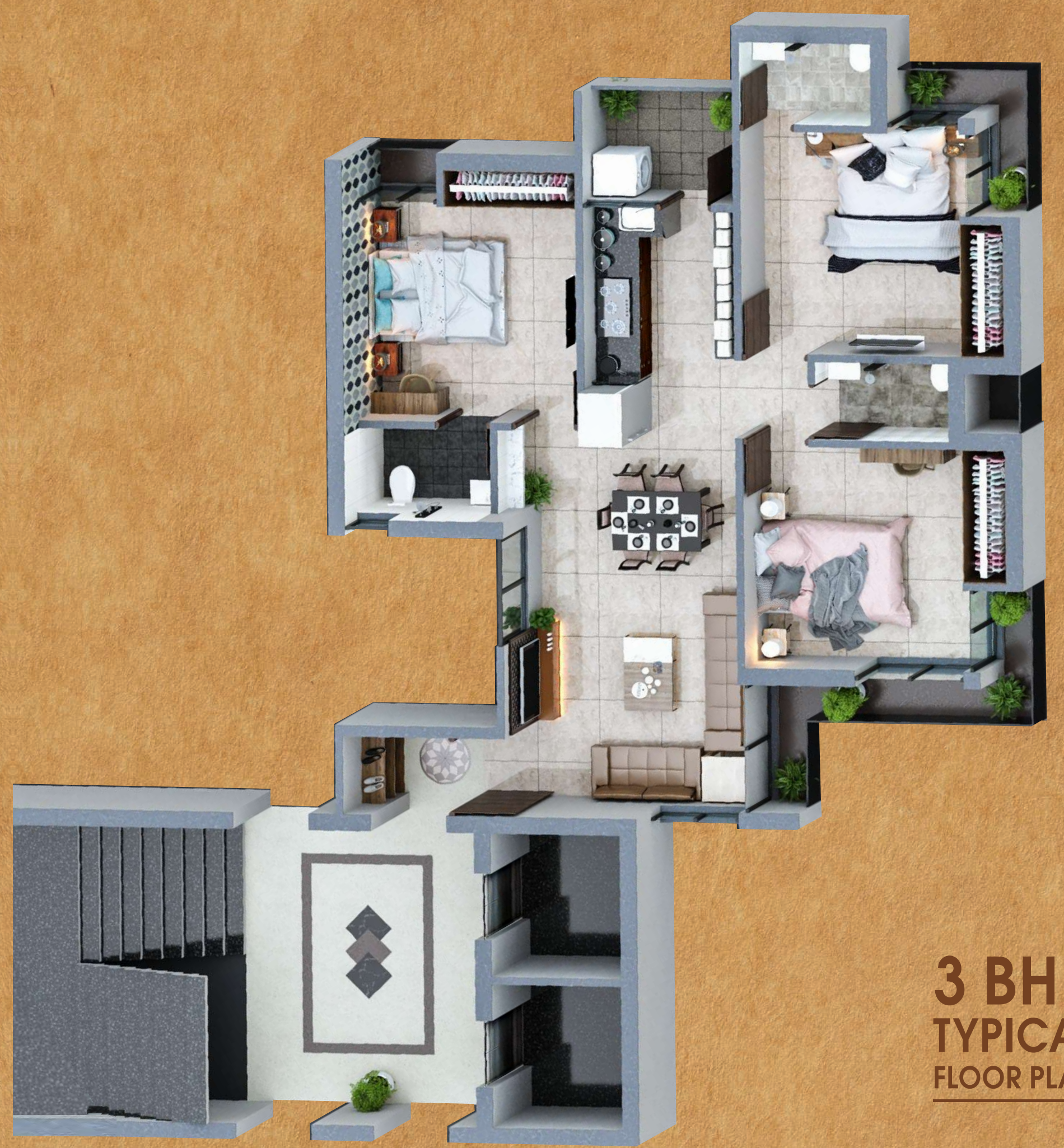
3 BHK TYPICAL FLOOR PLAN