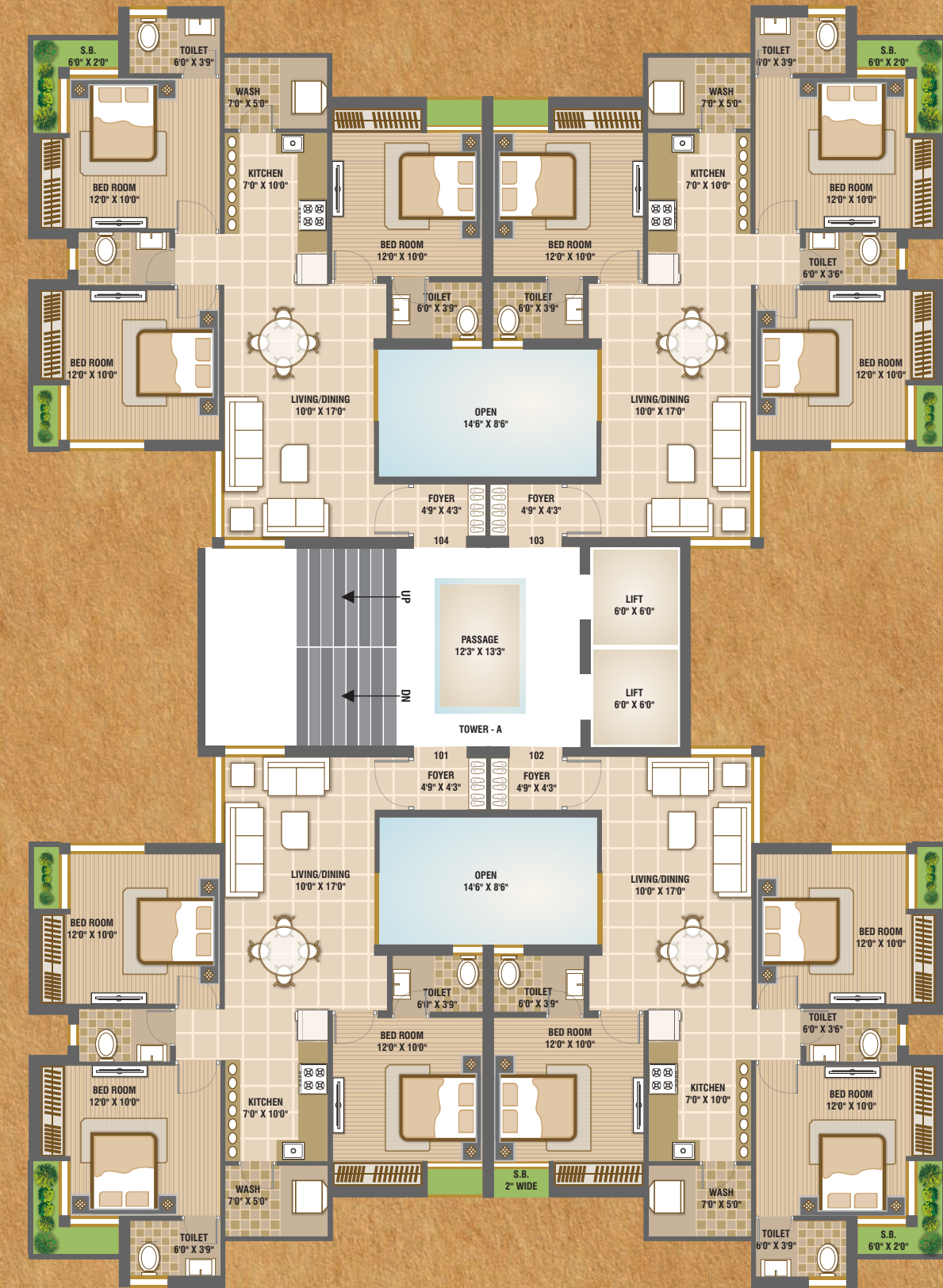
TYPICAL FLOOR PLAN

सर्वजन हिताय: सर्वजन सुखाय: पुष्पि हाईट्स