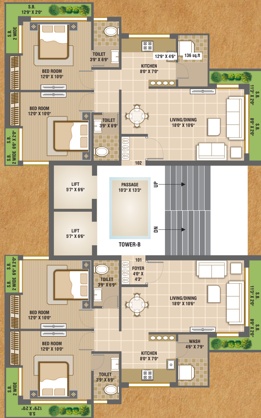
TYPICAL FLOOR PLAN