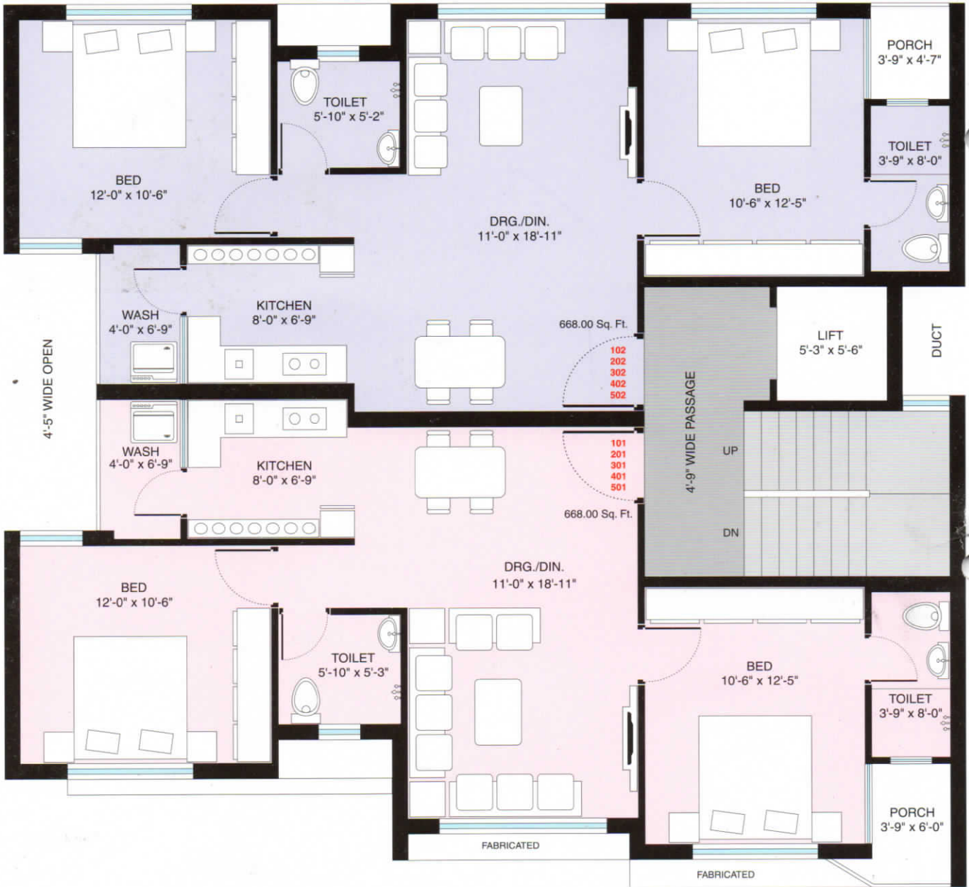
1st to 5th Floor Plan