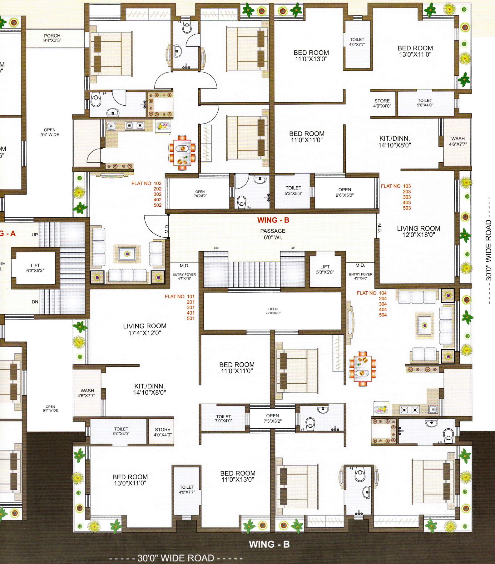
Typical 1st to 5th Floor Plan