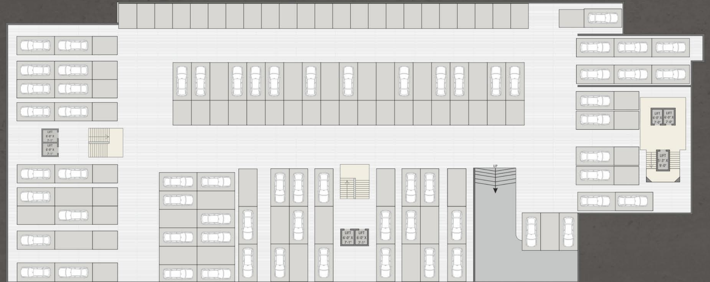
N BASEMENT 2