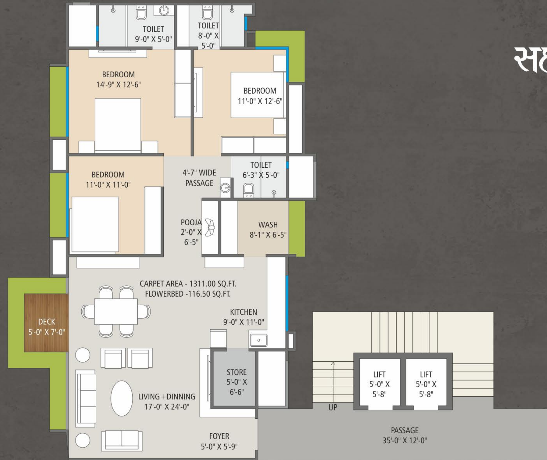
TYPICAL FLOOR PLAN | TYPE A