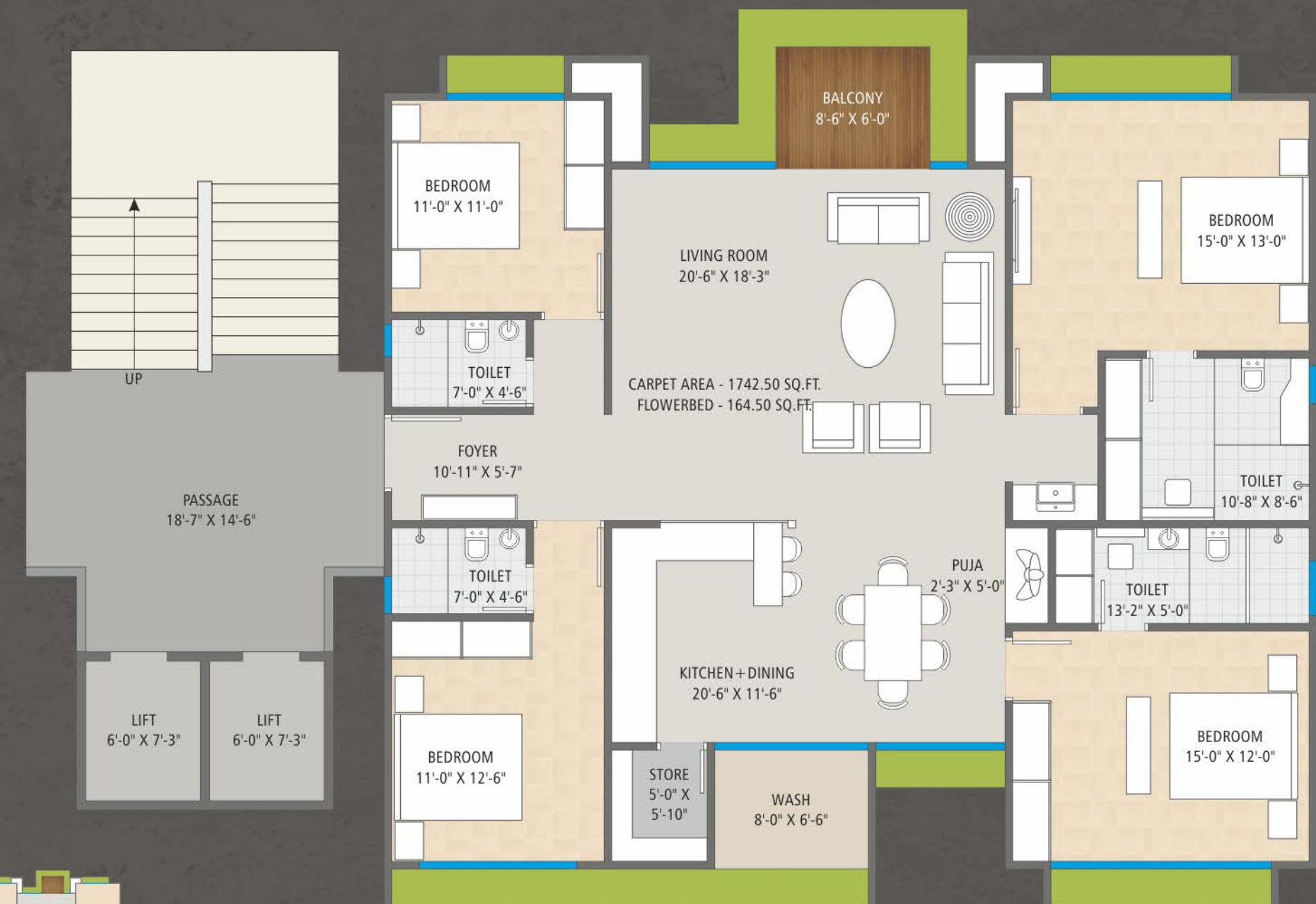
TYPICAL FLOOR PLAN | TYPE B