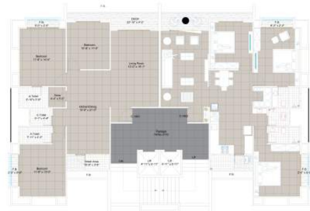
TYPE C 14th FLOOR