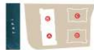
TYPE A & B 3 | 6 | 8 & 12th FLOOR