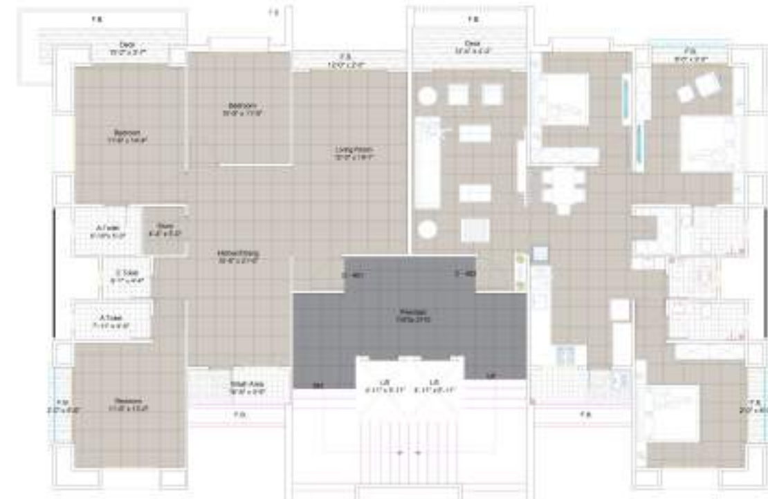
TYPE C 4 | 5 | 7 | 10 & 13th FLOOR