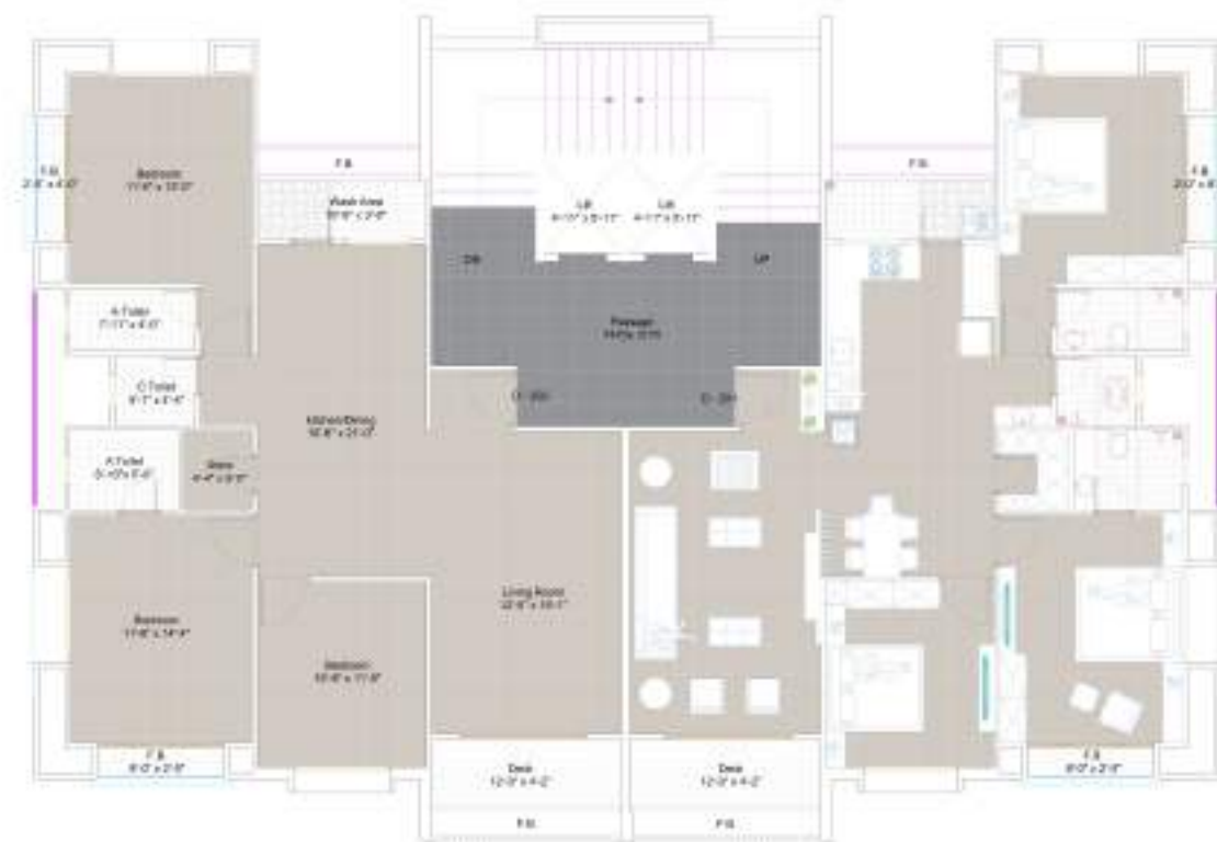
TYPE D 2 | 9 & 11th FLOOR