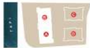
TYPE A & B 13th FLOOR