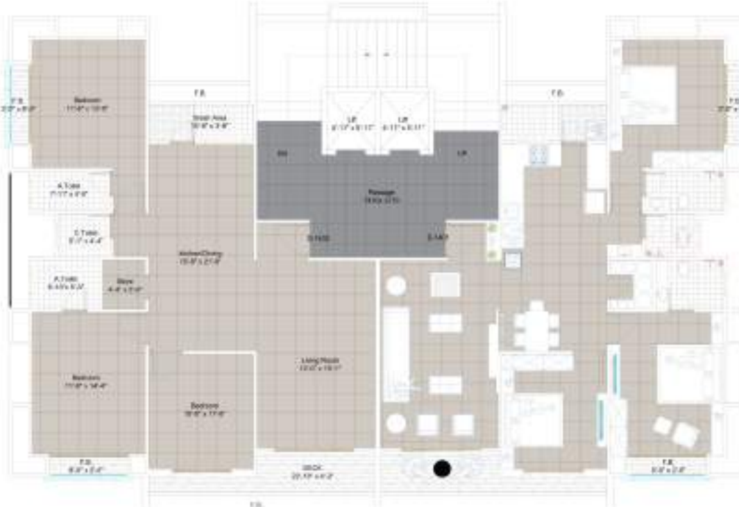
TYPE D 14th FLOOR