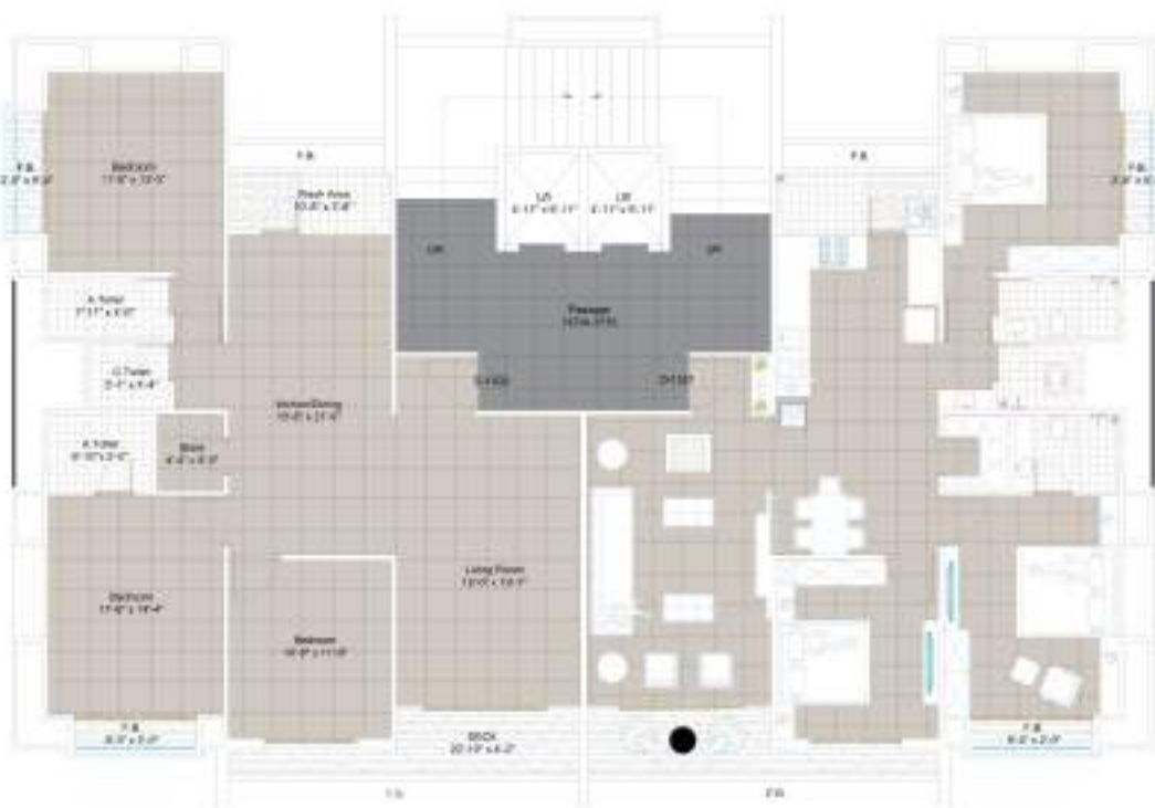
TYPE D 13th FLOOR