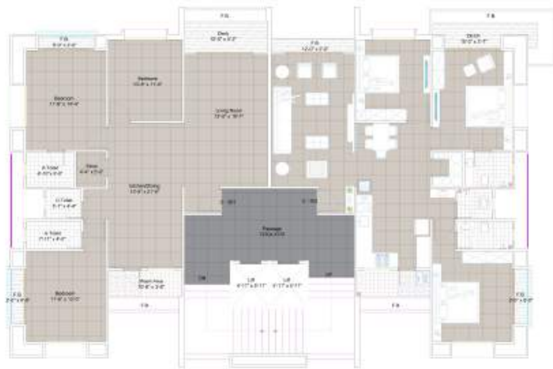
TYPE C 3 | 6 | 8 & 12th FLOOR