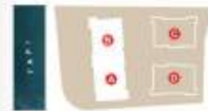
TYPE A & B 14th FLOOR