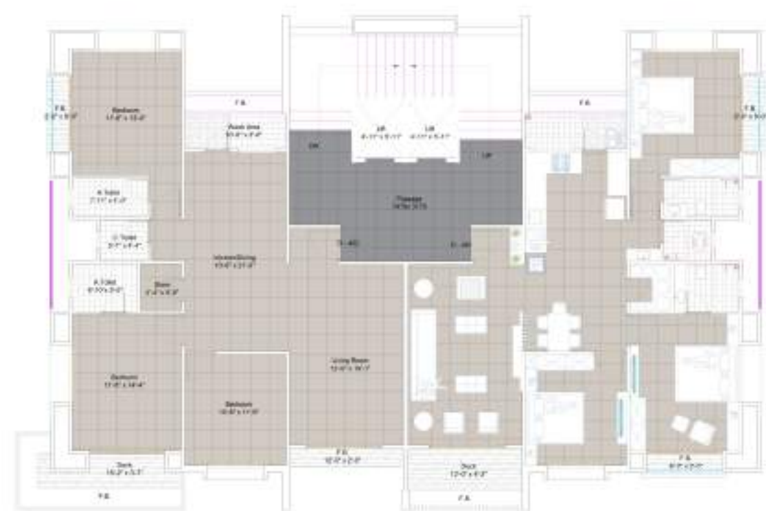
TYPE D 4 | 5 | 7 | 10 & 13th FLOOR