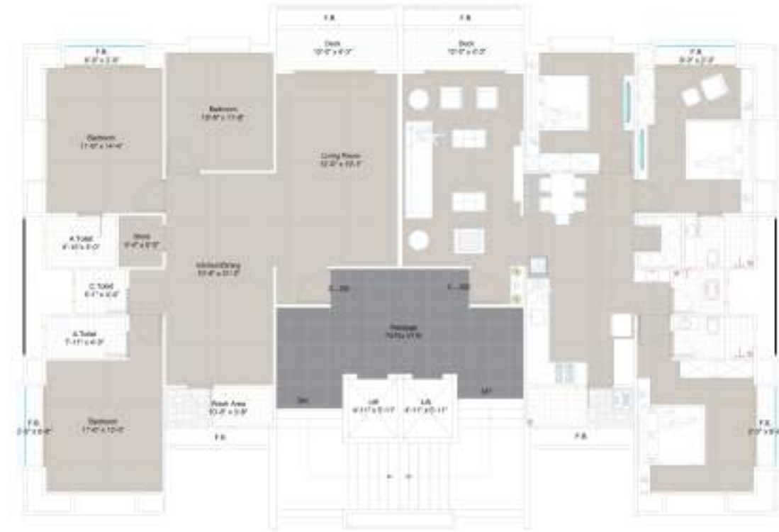
TYPE C 2 | 9 & 11th FLOOR