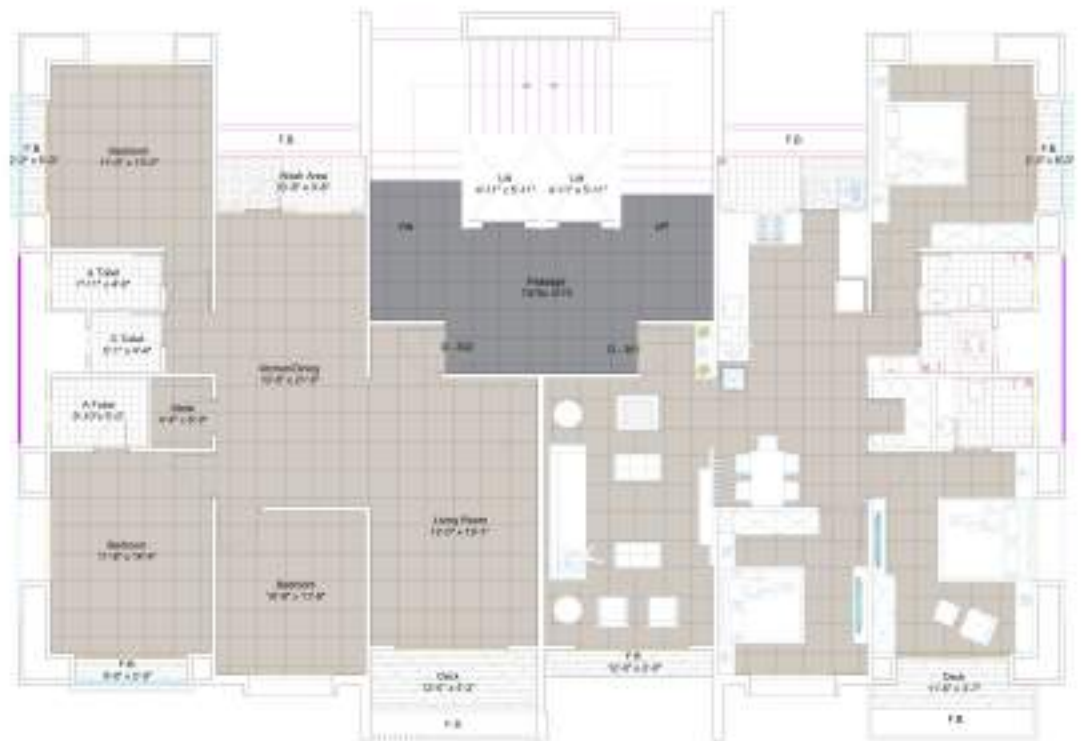
TYPE D 3 | 6 | 8 & 12th FLOOR