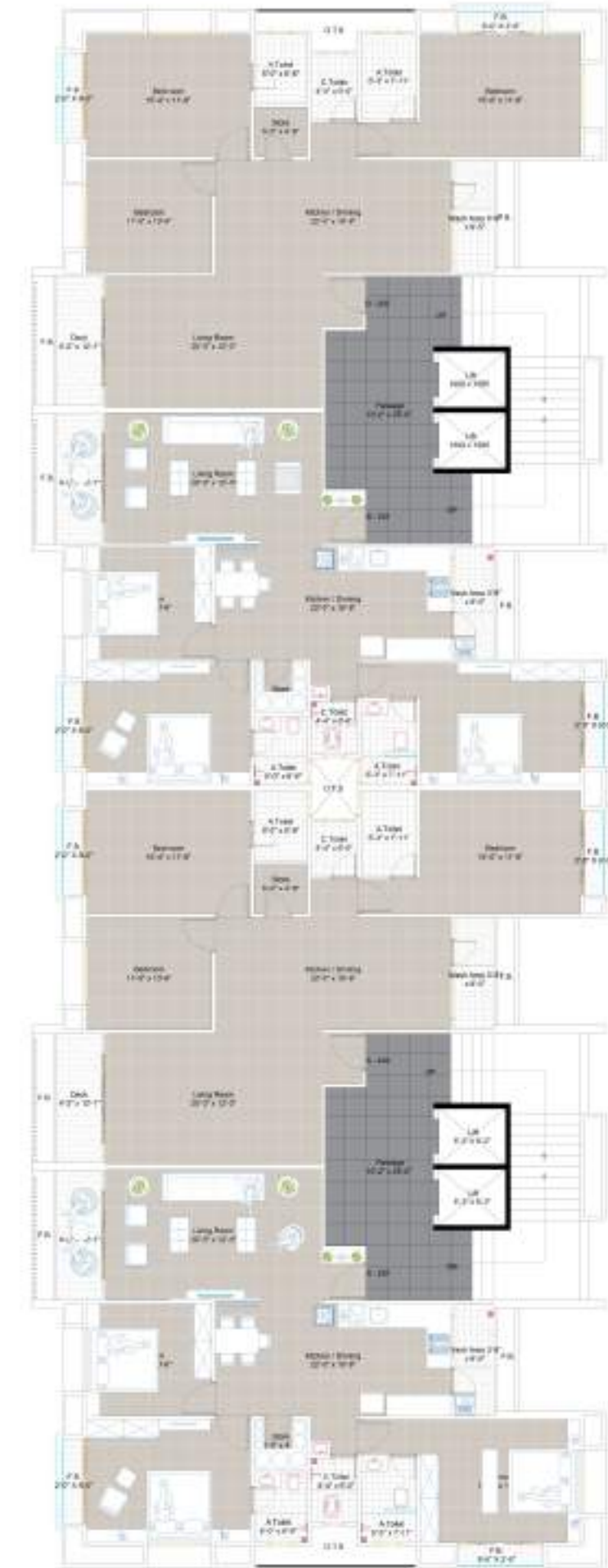
TYPE A & B 2 | 9 | & 11th FLOOR