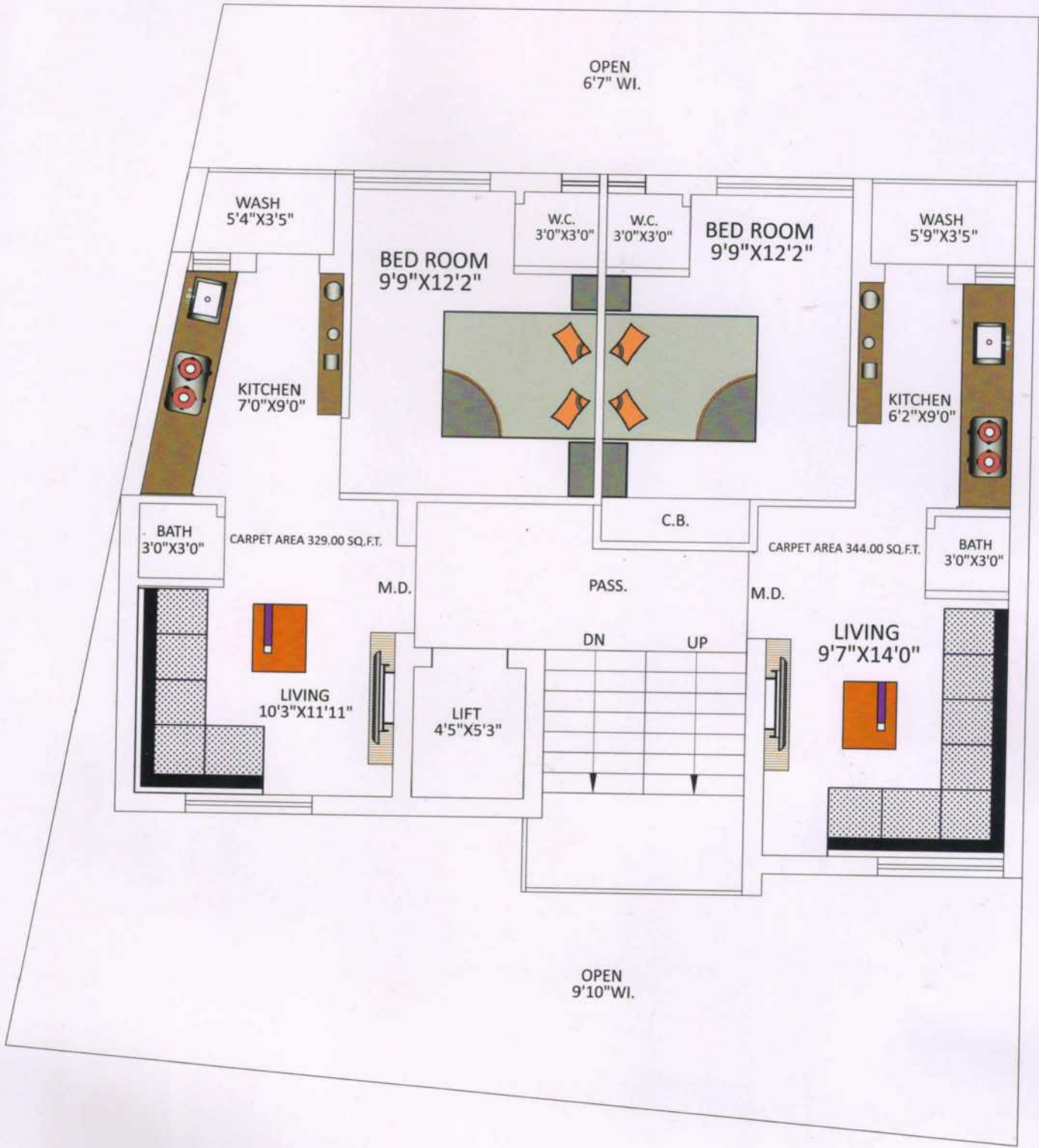
1st to 5th FLOOR PLAN