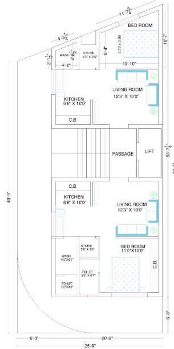
1st to 5th FLOOR PLAN