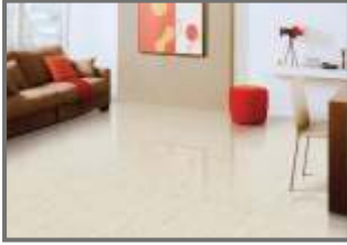
Vitrified Tiles Flooring