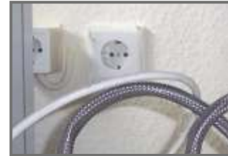
R.O. & Geyser Point in All Flats

• GST સહિતના સરકારશ્રીના કોઈપણ પ્રકારના ટેકસની જવાબદારી ખરીદનારે ભોગવવાની રહેશે. • PGVCL, GSPC તથા રાજકોટ મ્યુનિસીપલ કોર્પોરેશન ને લગતા અન્ય કોઈપણ પ્રકારના ચાર્જ અલગથી ચુકવવા પાત્ર રહેશે. • ભવિષ્યમાં FSI માં કોઈપણ પ્રકારનો ફેરફાર થશે તો પધારાના બાંધકામનો હકક ડેવલોપર્સનો રહેશે. • ક. ય. દ. કી. ચ પ્રશ્નોના નિવારણ માટે ન્યાયક્ષેત્ર રાજકોટ રહેશે.