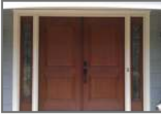
Attractive Main Door & Flush Door