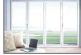
Powder Coated Aluminum Section Window for Side Seal