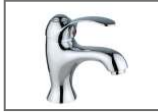
Standard Plumbing & Sanitary Fittings