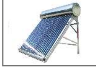
Solar Water Heater