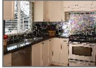
Granite Platform With Steel Sink