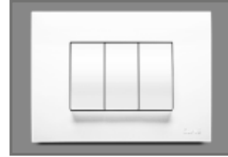
Concealed Wiring, Modular Switch and A.C. Point