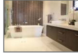
Fully Glazed Tiles in Kitchen & Toilet