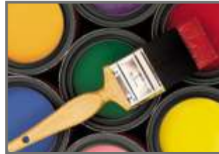
Outdoor Exterior Paint