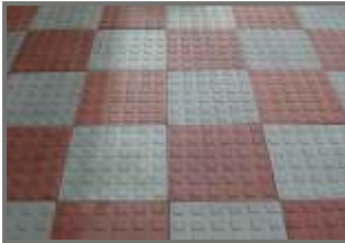
Tiles Flooring in Parking