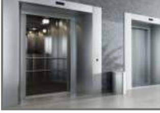
Standard Company Lift Express Company