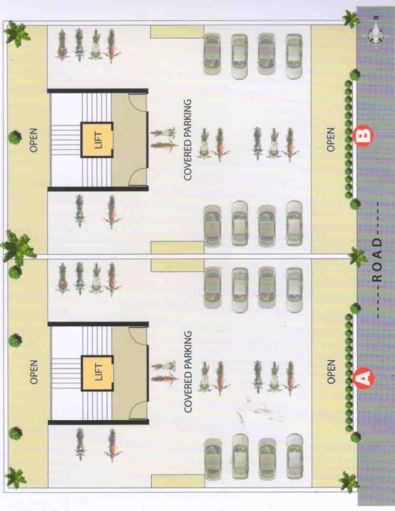
Ground Floor Plan (Parking)