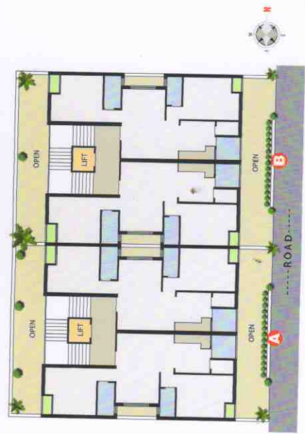
Typical Floor Plan (1 st to 5 th Floor)