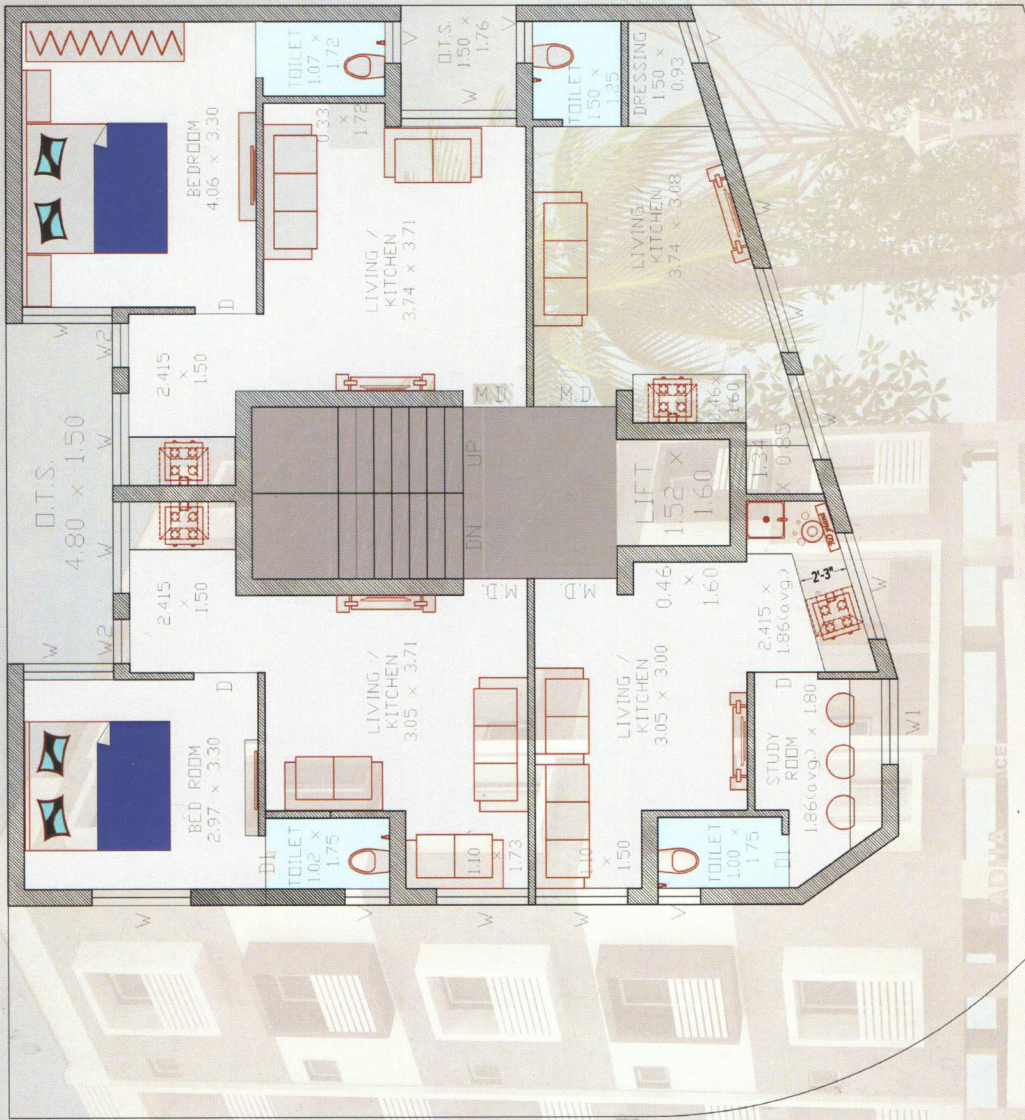
TYPICAL 1ST TO 5TH FLOOR PLAN