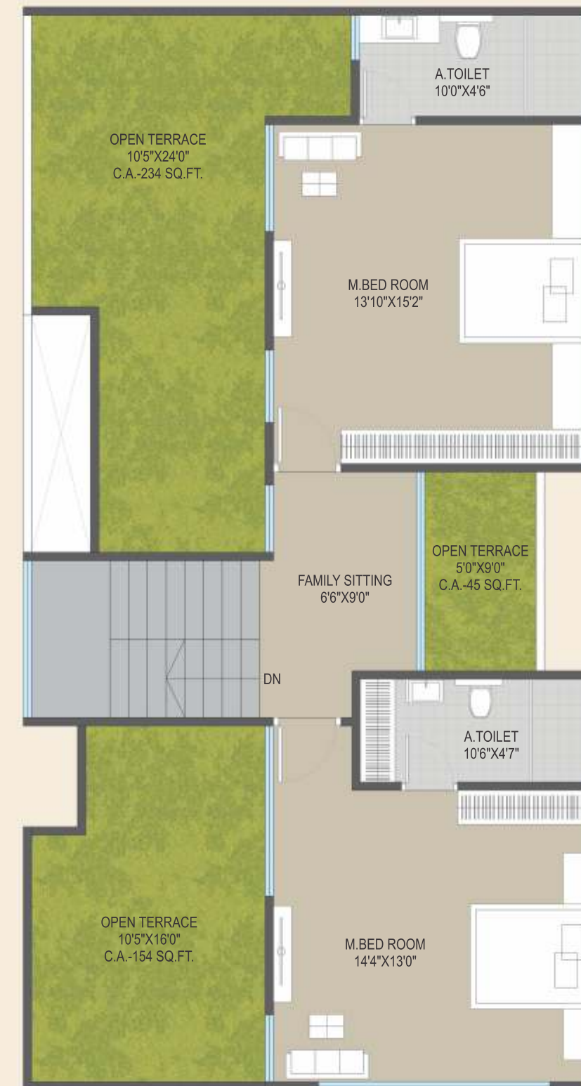
14 th Floor Plan PENTHOUSE