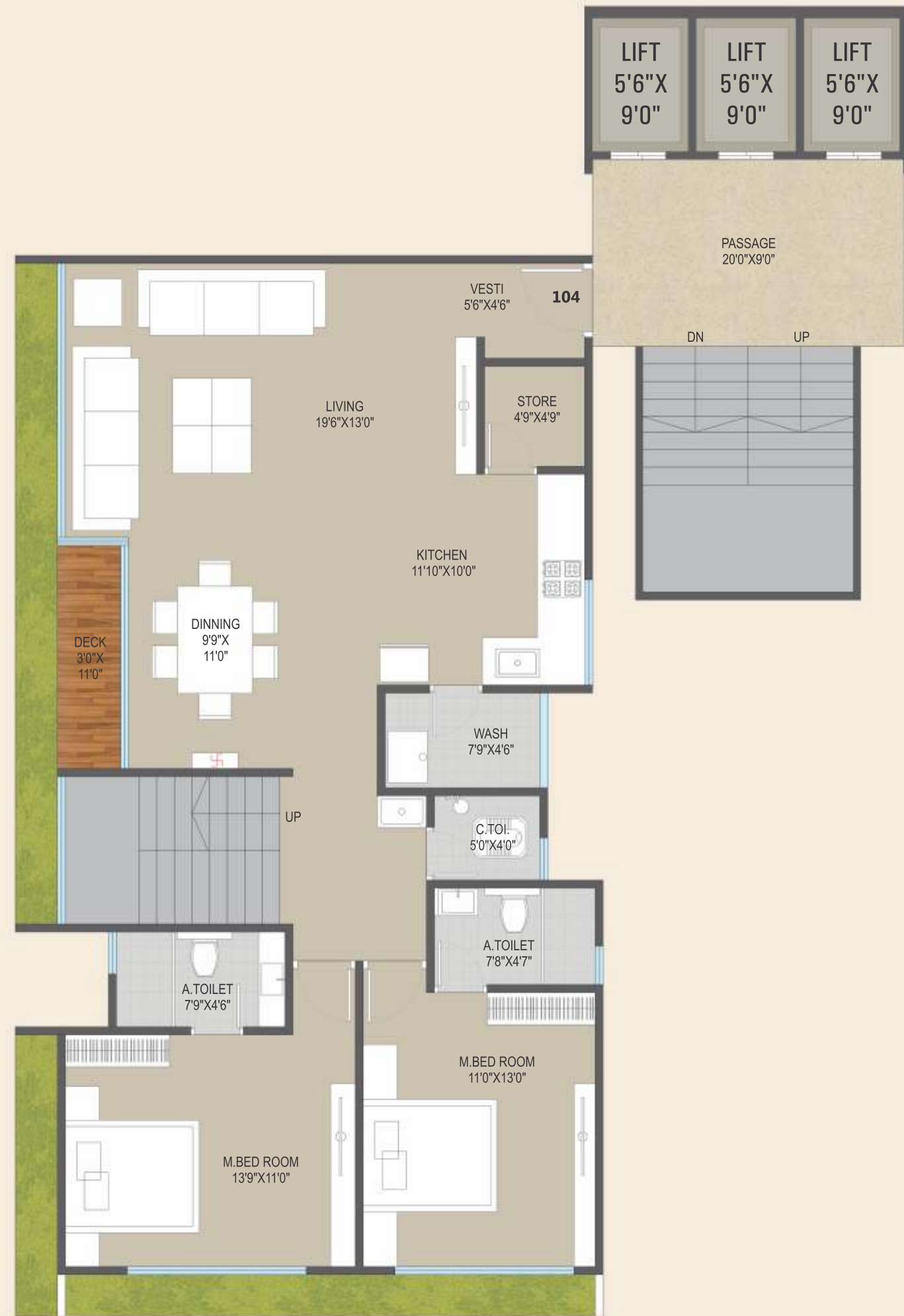
13 th Floor Plan PENTHOUSE