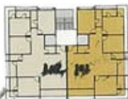
TOWER - A