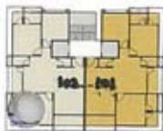
TOWER - B